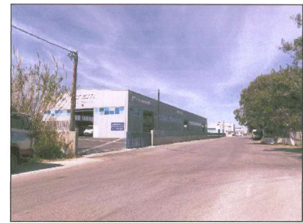
Θέση Φωτοληψίας 2