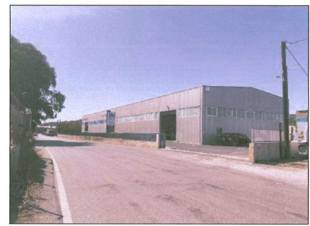
Θέση Φωτοληψίας 1