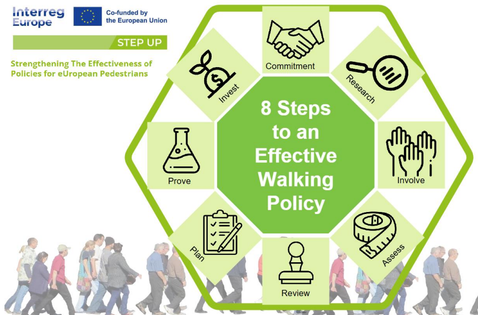
Εικόνα 1: Μεθοδολογία 8-βημάτων εφαρμογής δράσεων για το περπάτημα