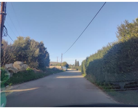
Εικόνα 2. υφιστάμενη κατάσταση στην οδό Αγ. Αλεξάνδρου (αυτοψία 1ος 2024)

Τα κυρίαρχα προβλήματα οδικής ασφάλειας της οδού σχετίζονται με: