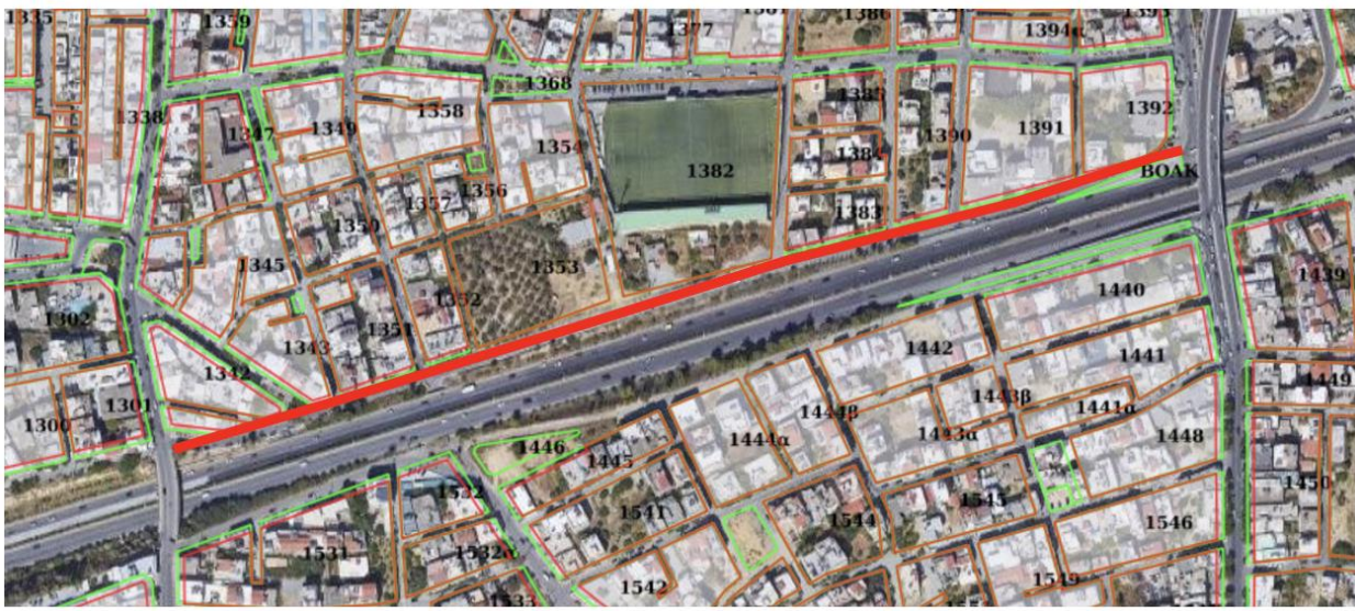
Εικόνα 1. εντοπισμός εξεταζόμενου τμήματος οδού

Παρακάτω παρουσιάζονται φωτογραφίες της οδού στην υφιστάμενη κατάσταση.