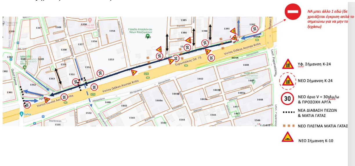
Εικόνα 5. απόσπασμα χάρτη