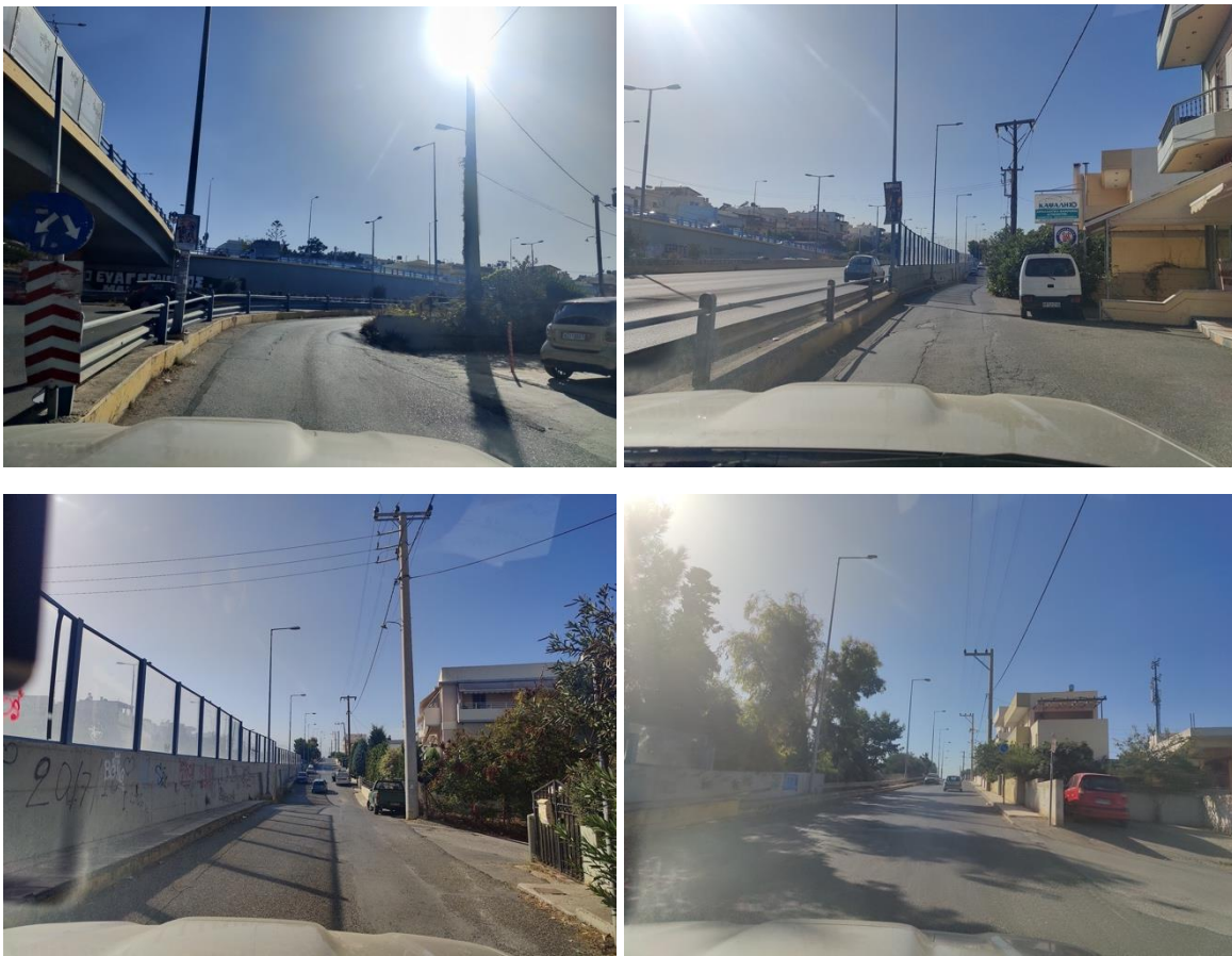
Εικόνα 2. φωτογραφίες της οδού (Νοέμβριος 2023)

Παρακάτω παρουσιάζονται φωτογραφίες της οδού στην υφιστάμενη κατάσταση.