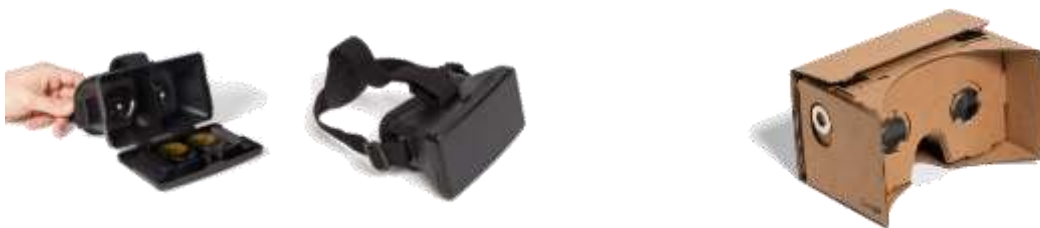
Εικόνα 4: Οικονομικά VR headsets και headset τύπου cardboard

Τρισδιάστατα μοντέλα και εικονικοί χαρακτήρες