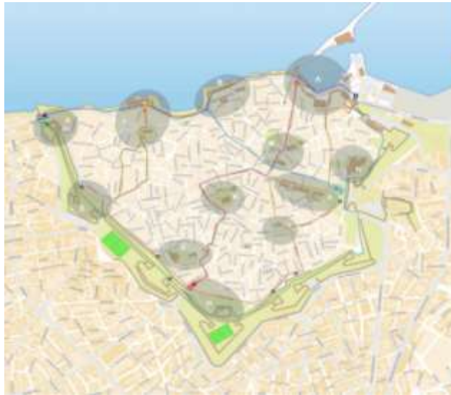
Εικόνα 2: Δίκτυο Διαδρομών

Συγκεκριμένα, με σκοπό την προώθηση του ιστορικού, πολιτιστικού και τουριστικού χαρακτήρα της Π.Π.Β.Α.Α. προτείνεται η προβολή των παρακάτω πέντε διαδρομών. Οι διαδρομές αυτές καλύπτουν σχεδόν το σύνολο των μνημείων της Π.Π.Β.Α.Α. , καθώς επίσης διασχίζουν περιοχές στις οποίες αναπτύσσεται μια σχετικά ικανοποιητική παρουσία κοινωνικής – οικονομικής δραστηριότητας, αντιπροσωπευτικής της σημερινής οργάνωσης της πόλης. Στην Εικόνα 2 παρουσιάζεται ο χάρτης με το Δίκτυο των Διαδρομών σε σχέση με τις περιοχές οι οποίες περιλαμβάνουν συγκεντρώσεις σημείων ενδιαφέροντος.