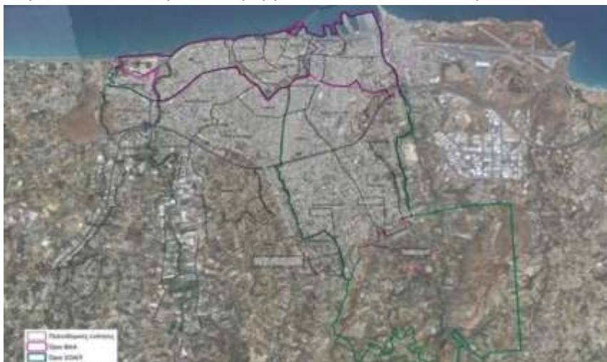
Εικόνα 1: Περιοχή Παρεμβάσεως Β.Α.Α

Το παρόν έργο επικεντρώνεται στην περιοχή παρέμβασης Β.Α.Α. που επισημαίνεται στην Εικόνα 1 ως όριο ΒΑΑ.