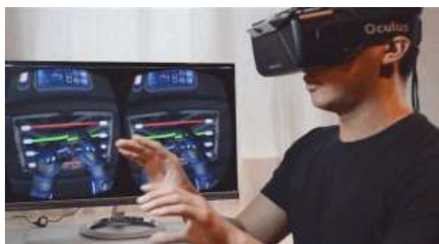
Εικόνα 6: Παράδειγμα χρήσης VR headset τύπου Oculus Rift

Χρήση υποδομής περιεχομένου: video 360°, τρισδιάστατα μοντέλα και εικονικοί χαρακτήρες