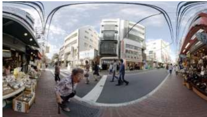
Εικόνα 3: Παράδειγμα θέασης 360° video

Το υπό προμήθεια λογισμικό θα διατίθεται μέσω διαδικτύου, κινητών συσκευών και τρίτων οθονών (κάσκες εικονικής πραγματικότητας) ανά περίπτωση.