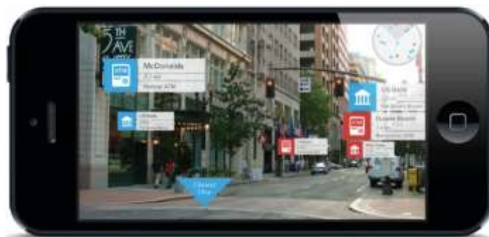
Εικόνα 5: Παράδειγμα χρήση AR από κινητό τηλέφωνο

Σενάριο, τρισδιάστατα μοντέλα και εικονικοί χαρακτήρες