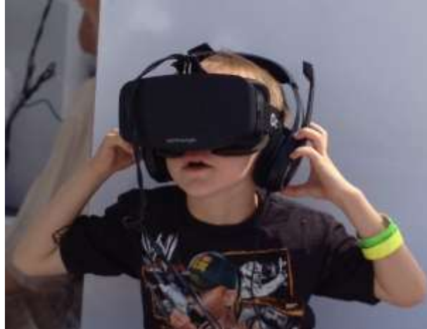
Εικόνα 7: Παράδειγμα χρήσης για παιχνίδια

Video 360°, τρισδιάστατα μοντέλα και εικονικοί χαρακτήρες