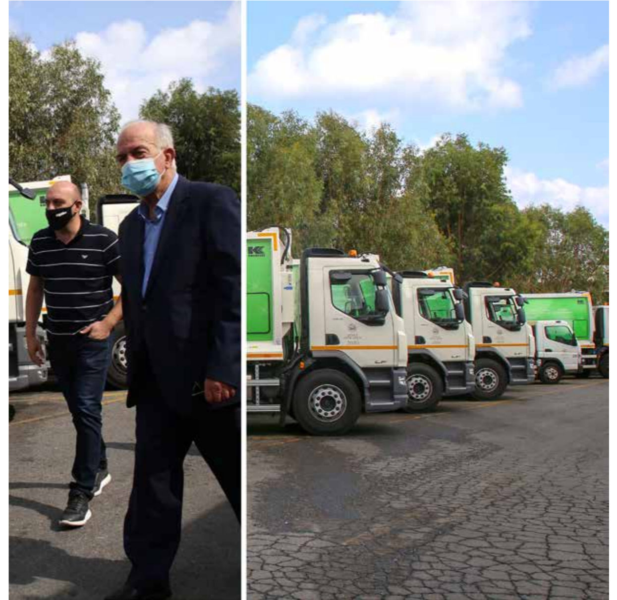
ΕΝΙΣΧΥΣΗ ΤΟΥ ΣΤΟΛΟΥ ΤΗΣ ΚΑΘΑΡΙΟΤΗΤΑΣ ΜΕ ΠΕΝΤΕ ΝΕΑ ΑΠΟΡΡΙΜΜΑΤΟΦΟΡΑ | Σεπτέμβριος 2020