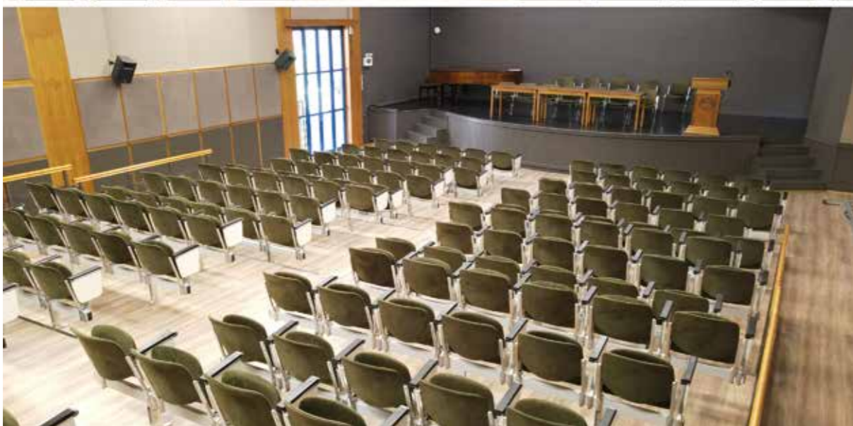
ΟΛΟΚΛΗΡΩΣΗ ΑΝΑΚΑΙΝΙΣΗΣ ΑΙΘΟΥΣΑΣ «Μ. ΚΑΡΕΛΛΗΣ»