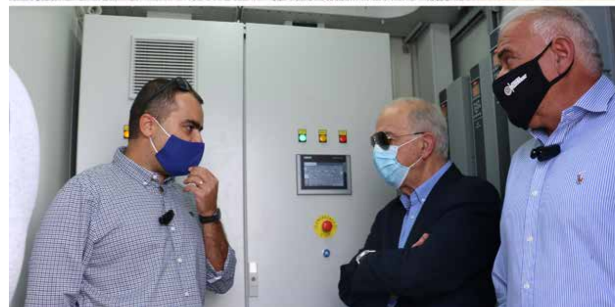
Δημιουργία νέας μονάδας Αφαλατώσεως στην ΔΕΥΑΗ Ο Δήμαρχος Ηρακλείου Βασίλης Λαμπρινός στα εγκαίνια της Μονάδας Αφαλάτωσης | 12/10/2020