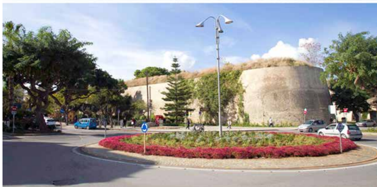
ΕΝΑΡΞΗ ΤΡΙΤΗΣ ΗΛΕΚΤΡΟΚΙΝΗΤΗΣ ΓΡΑΜΜΗΣ MINI BUS | 22/3/2021 ΔΗΜΙΟΥΡΓΙΑ ΝΕΟΥ ΚΥΚΛΟΦΟΡΙΑΚΟΥ ΚΟΜΒΟΥ ΣΤΗΝ ΟΑΣΗ