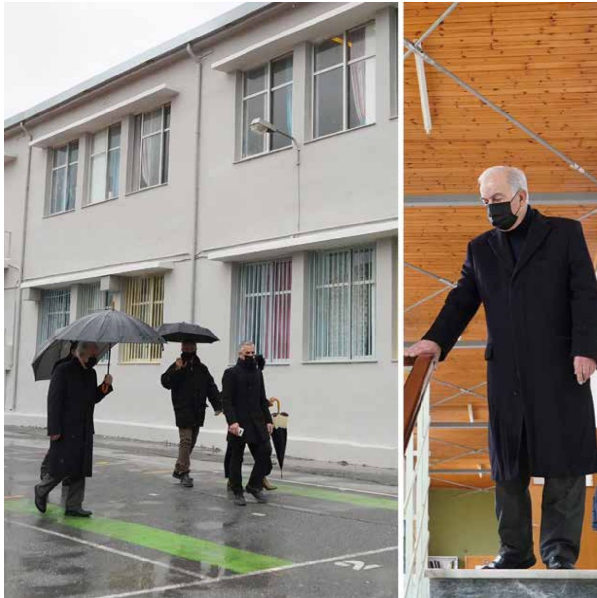
Ο Δήμαρχος Ηρακλείου στο 21ο Δημοτικό Σχολείο στην Φορτέτσα | 15/2/2021

Το σύστημα έχει εφαρμοστεί στις με επιτυχία στον Σταυρό της Πόλης (Μείντάνι), στην οδό Μιλάτου, στο Πάρκο Θεοτοκουπούλου (οδός Μινωταύρου), στην Πλατεία 18 Άγγλων και στην Πλατεία Δασκαλογιάννη