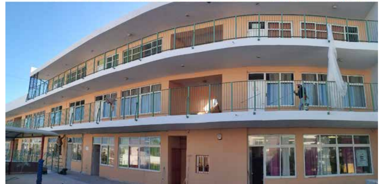
23ο ΔΗΜΟΤΙΚΟ | ΠΡΙΝ & ΜΕΤΑ