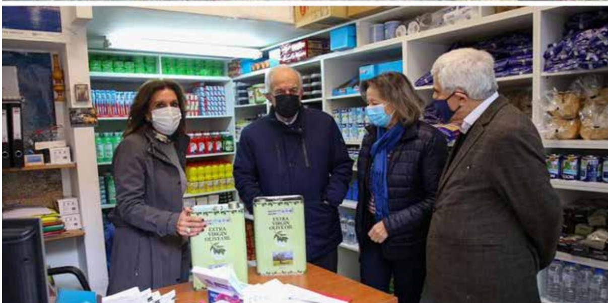
Συλλογή ελαιόκαρπου από τα ελαιόδεντρα του Δήμου Ηρακλείου με ωφελουμένους των κοινωνικών υπηρεσιών σε συνεργασία με την ΔΕΠΑΝΑΛ Ο Δήμαρχος Ηρακλείου Βασίλης Λαμπρινός στην παράδοση του ελαιολάδου στο Δημοτικό Παντοπωλείο 17 Δεκεμβρίου 2020