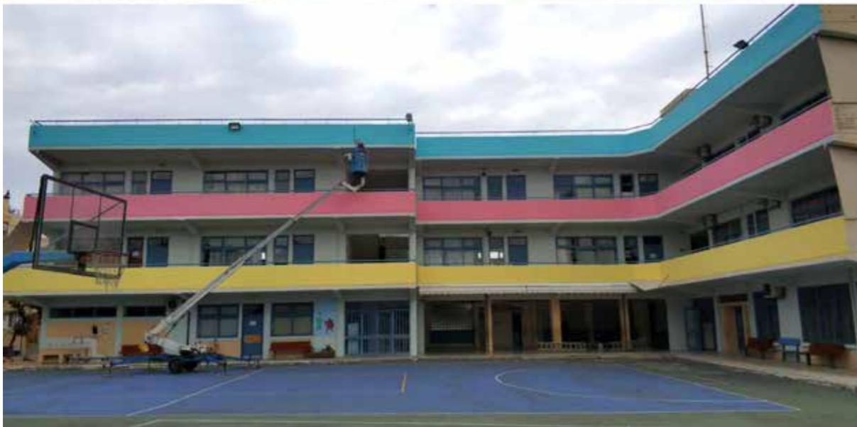
5ο ΔΗΜΟΤΙΚΟ | ΠΡΙΝ & ΜΕΤΑ