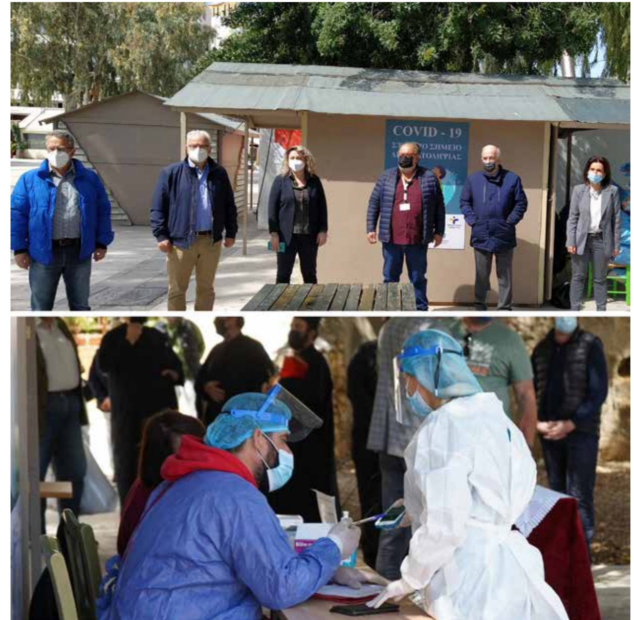
Συνεργασία με Περιφέρεια Κρήτης και 7η ΥΠΕ για την δημιουργία δυο σταθερών σταθμών rapid test στο κέντρο του Ηρακλείου Σταθμός Πλατείας Ελευθερίας | Σταθμός Πλατείας Αγίας Αικατερίνης (Άγιος Μηνάς)