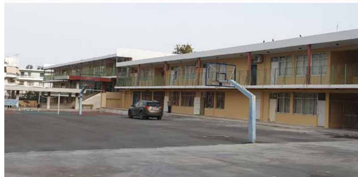
4ο ΛΥΚΕΙΟ | ΠΡΙΝ & ΜΕΤΑ