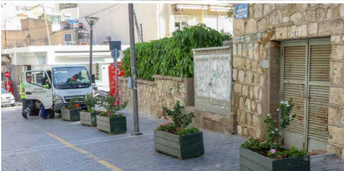
ΟΔΟΣ ΜΙΝΩΤΑΥΡΟΥ - ΠΑΡΚΟ ΘΕΟΤΟΚΟΠΟΥΛΟΥ | ΠΡΙΝ & ΜΕΤΑ