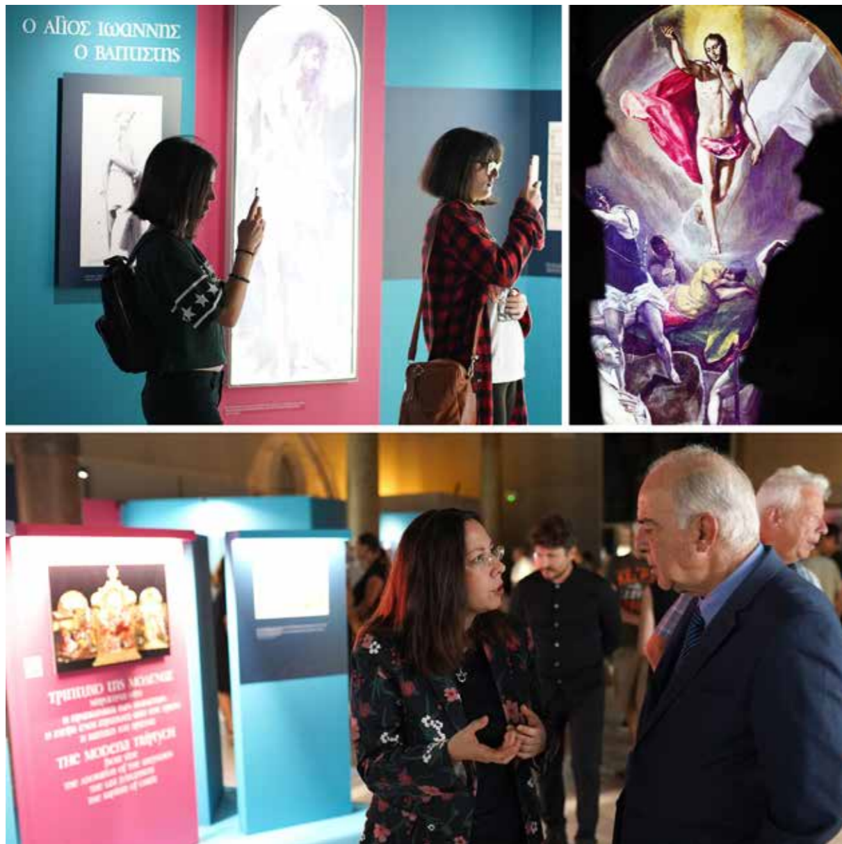
Ο Δήμαρχος Ηρακλείου Βασίλης Λαμπρινός στα Εγκαίνια της Έκθεσης | 10/09/2019

Έκθεση σύγχρονης εικαστικής τεχνολογίας, με ψηφιακές αναπαραγωγές έργων του Δομήνικου Θεοτοκόπουλου Βραβεύτηκε στα «Tourism Awards 2020».