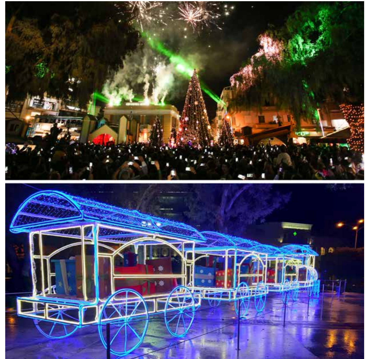
ΧΡΙΣΤΟΥΓΕΝΝΙΑΤΙΚΟ ΚΑΣΤΡΟ 2019 | 2020