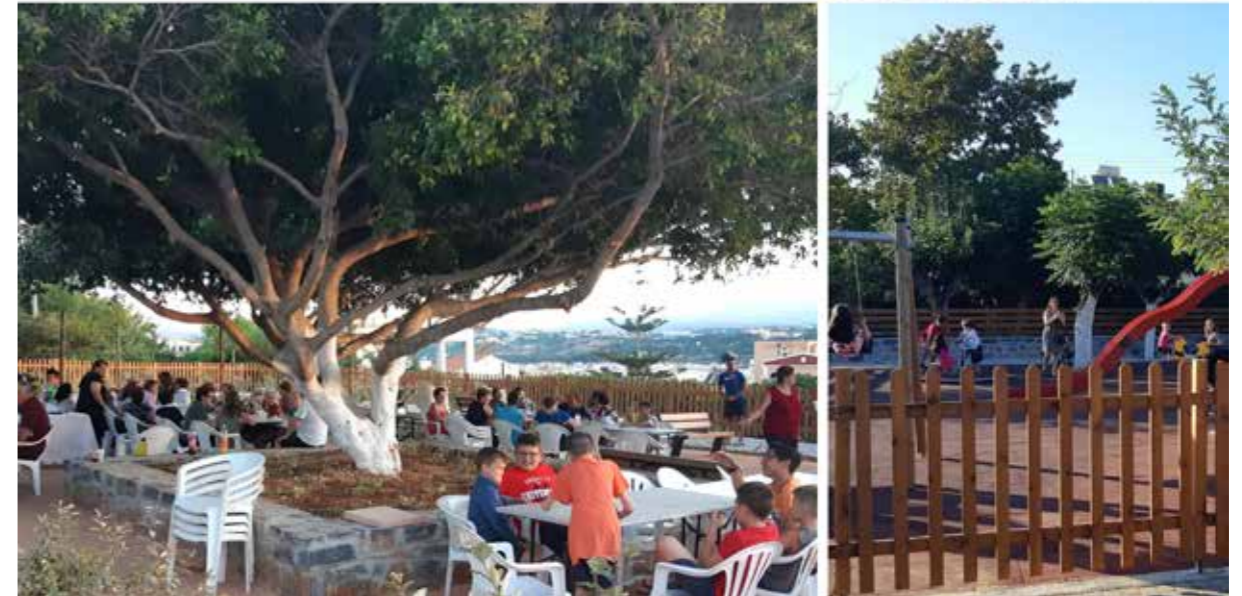
ΠΑΡΚΟ ΚΑΡΑΜΑΝΛΗ | ΠΡΙΝ & ΜΕΤΑ Διαμόρφωση νέου χώρου πρασίνου