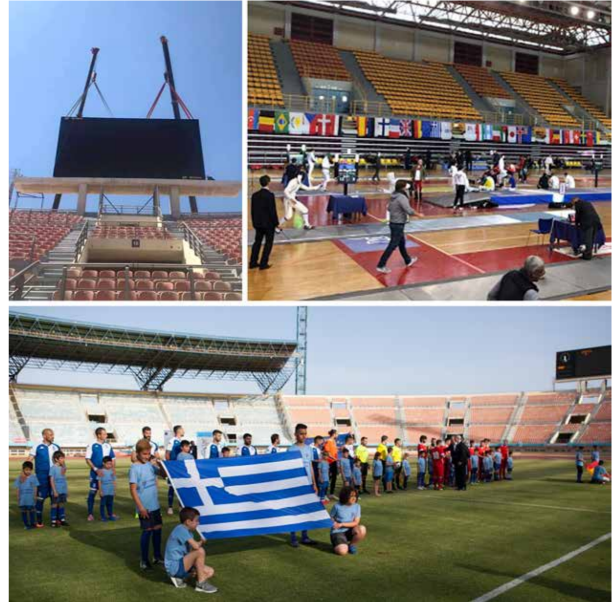
Τοποθέτηση νέου ηλεκτρονικού πίνακα στο Παγκρήτιο | 16 Ιουλίου 2021 Από το καλοκαίρι του 2019 και μέχρι τον Μάρτιο του 2020, όταν επιβλήθηκε το πρώτο lockdown, ο Δήμος Ηρακλείου συνέχισε να φιλοξενεί και να διοργανώνει αθλητικές διοργανώσεις διεθνούς εμβέλειας. Τον Μάρτιο του 2021 ξεκίνησε και πάλι.