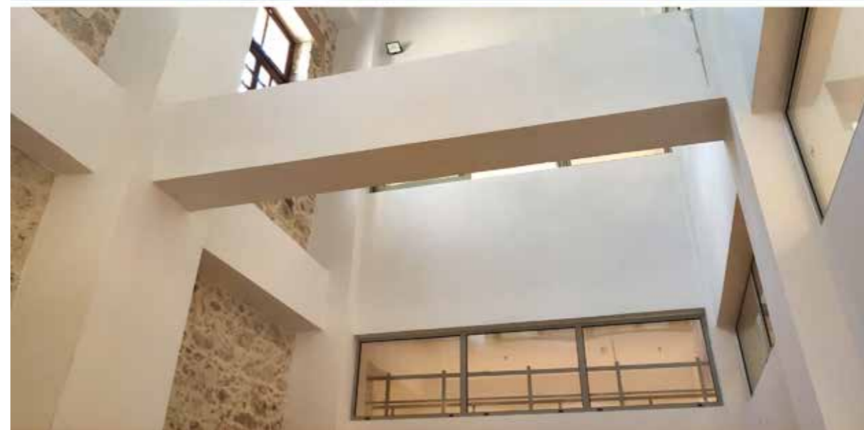
ΟΛΟΚΛΗΡΩΣΗ ΝΕΟΥ ΒΡΕΦΟΝΗΠΙΑΚΟΥ ΣΤΑΘΜΟΥ ΣΤΙΣ ΜΕΣΑΜΠΕΛΙΕΣ | 1η φωτογραφία ΟΛΟΚΛΗΡΩΣΗ ΝΕΟΥ ΚΔΑΠ ΜΕΑ ΣΤΗΝ ΑΡΧΙΕΠΙΣΚΟΠΟΥ ΜΑΚΑΡΙΟΥ | 2η φωτογραφία