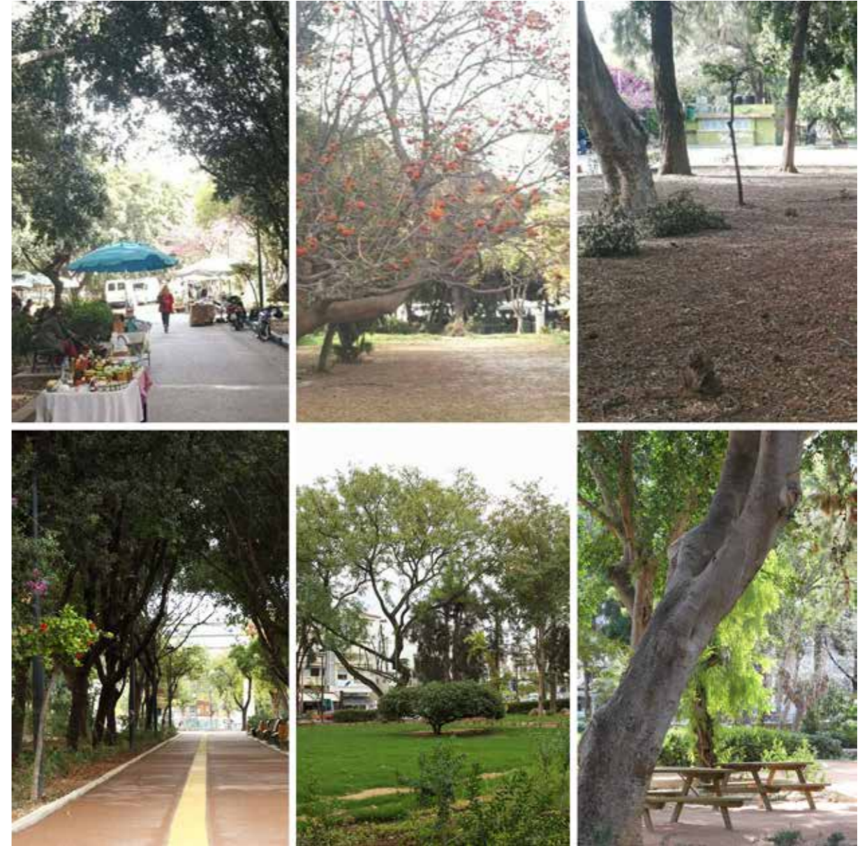
Πάρκο Γεωργιάδη | ΠΡΙΝ & ΜΕΤΑ