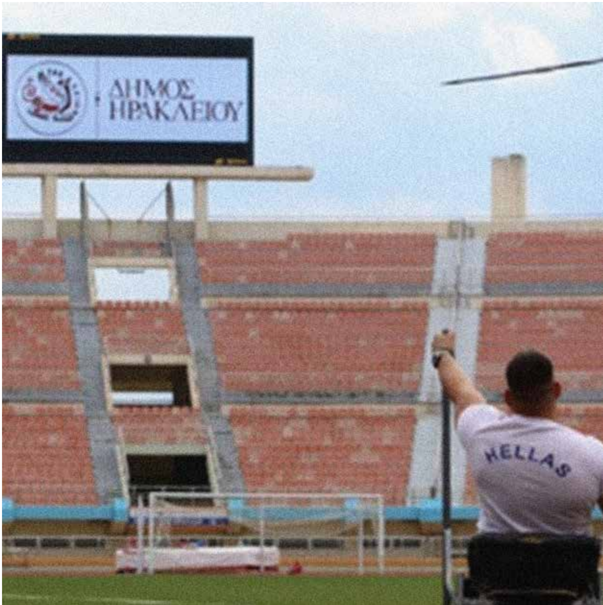
Ημερίδα στίβου για ΑμεΑ | Μάρτιος 2021