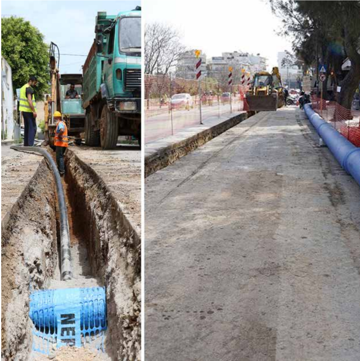
Συνέχεια των έργων αντικατάστασης υδρευτικού δικτύου σε διάφορες περιοχές του Ηρακλείου Έχει δρομολογηθεί το μεγάλο έργο της αντικατάστασης 150 χιλιομέτρων πεπαλαιωμένων δικτύων ιδρεύσεως

Η ΑΑΗ ΑΕ ΟΤΑ σε συνεργασία με τις αρμόδιες υπηρεσίες του Δήμου Ηρακλείου, την Περιφέρεια Κρήτης και το Υφυπουργείο Αθλητισμού, προχώρησε σε μια σειρά ενεργειών και δρομολόγησε μεγάλα έργα με στόχο την αναβάθμιση των υφιστάμενων αθλητικών εγκαταστάσεων της πόλης και κυρίως του Παγκρητίου Σταδίου.