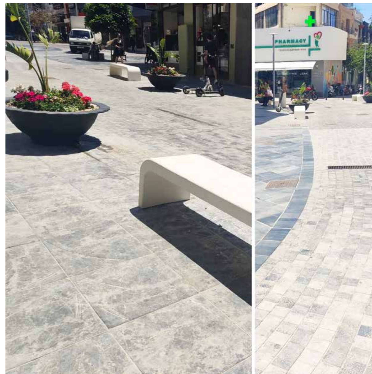
ΟΛΟΚΛΗΡΩΣΗ ΑΝΑΠΛΑΣΗΣ ΟΔΟΥ ΨΑΡΟΜΗΛΙΓΚΩΝ