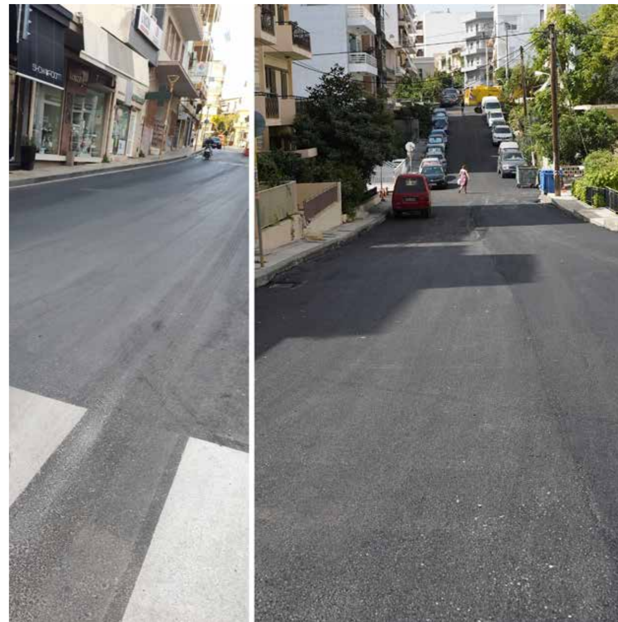
ΑΓΙΟΥ ΜΗΝΑ | ΕΡΓΑΤΙΚΟ ΚΕΝΤΡΟ