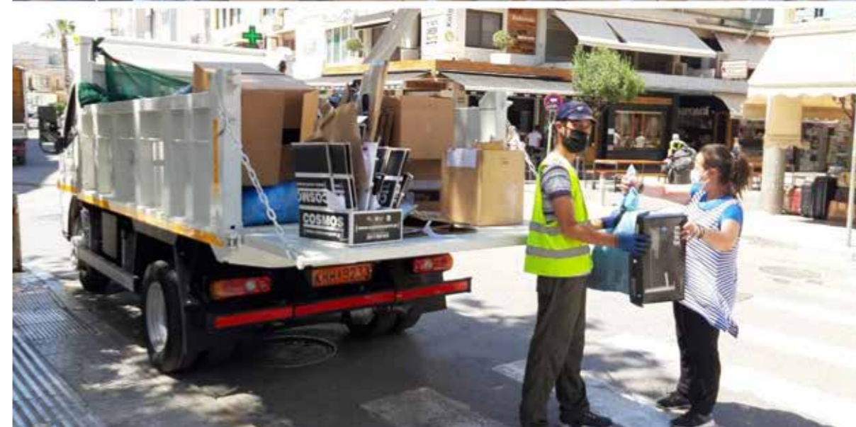
ΣΤΑΥΡΟΣ ΤΗΣ ΠΟΛΗΣ | ΠΡΙΝ & ΜΕΤΑ