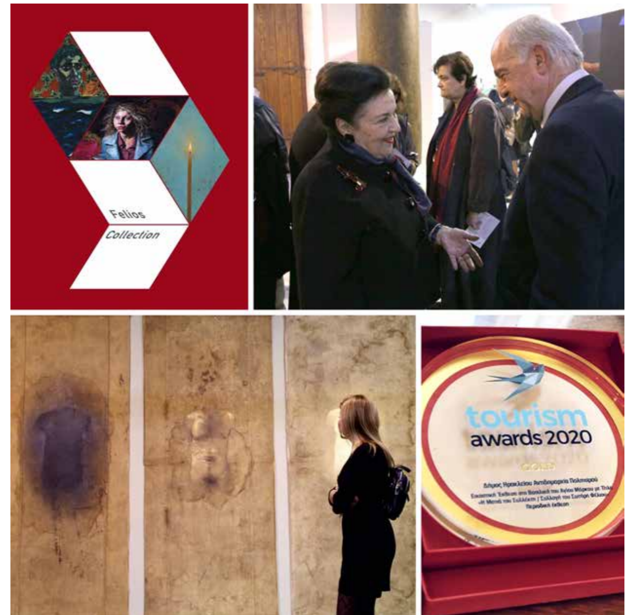
Ο Δήμαρχος Ηρακλείου στα εγκαίνια της Έκθεσης (24 Μαρτίου 2019) Τέσσερα βραβεία, δυο χρυσά και δύο ασημένια, κέρδισε ο Δήμος Ηρακλείου στα «Tourism Awards 2020»