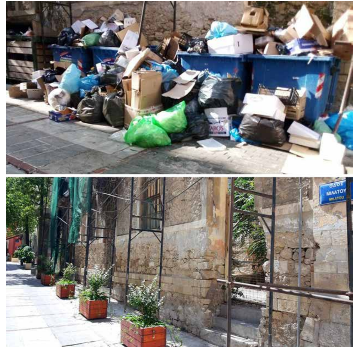
ΟΔΟΣ ΜΙΛΑΤΟΥ | ΠΡΙΝ & ΜΕΤΑ