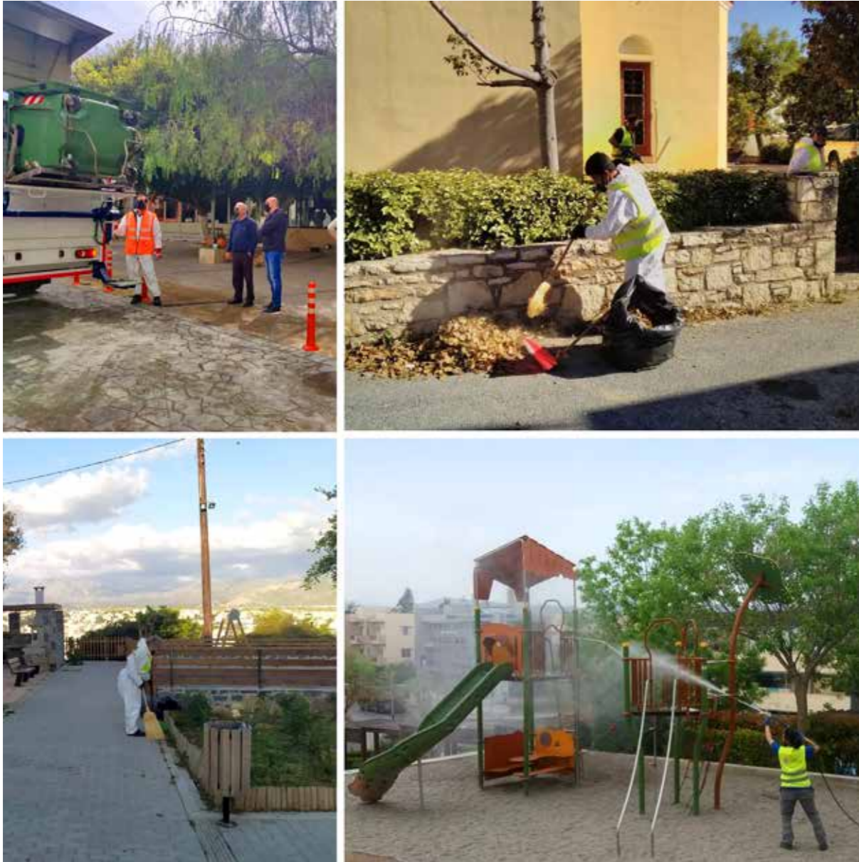
ΣΚΑΛΑΝΙ | ΠΡΟΦΗΤΗΣ ΗΛΙΑΣ | ΔΕΙΛΙΝΟ | ΑΓΙΟΣ ΙΩΑΝΝΗΣ ΚΝΩΣΣΟΥ

Με στοχευμένες και ολοκληρωμένες δράσεις, η Υπηρεσία Καθαριότητας παρεμβαίνει σχολαστικά κάθε Σάββατο σε συνοικίες και κοινότητες του Δήμου Ηρακλείου.