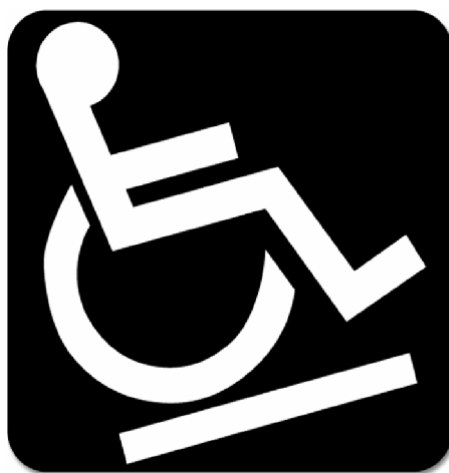
Σχήμα 73 του οδηγού «Σχεδιάζοντας για όλους»