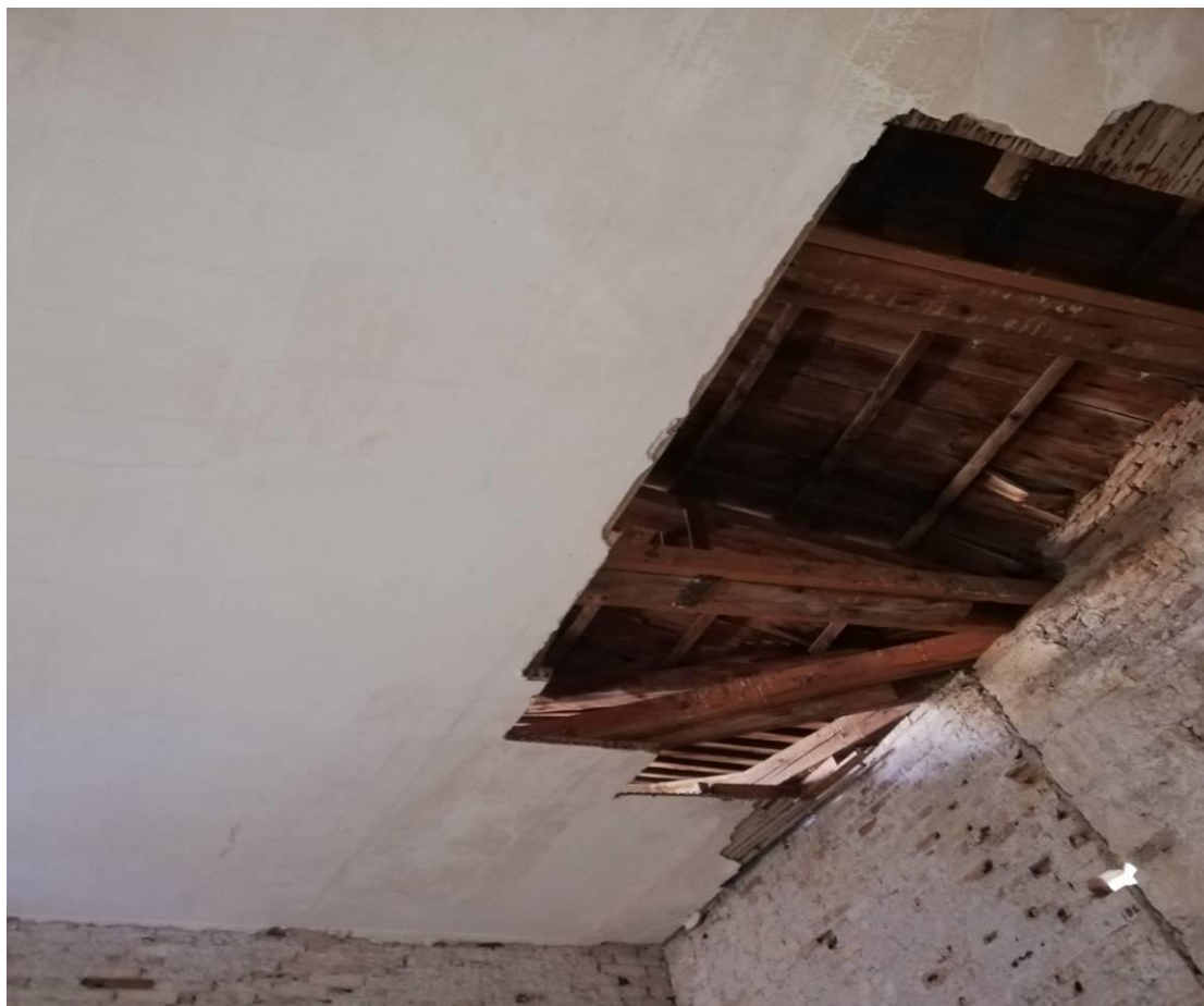
Μέρος σαθρών τεγίδων

Αφού γίνει απομάκρυνση της επικεράμωσης, θα πραγματοποιηθεί αντικατάσταση των σαθρών τεγίδων της στέγης οι οποίες έχουν διαβρωθεί λόγω τις εισχώρησης υδάτων, με νέες ίδιας διατομής.