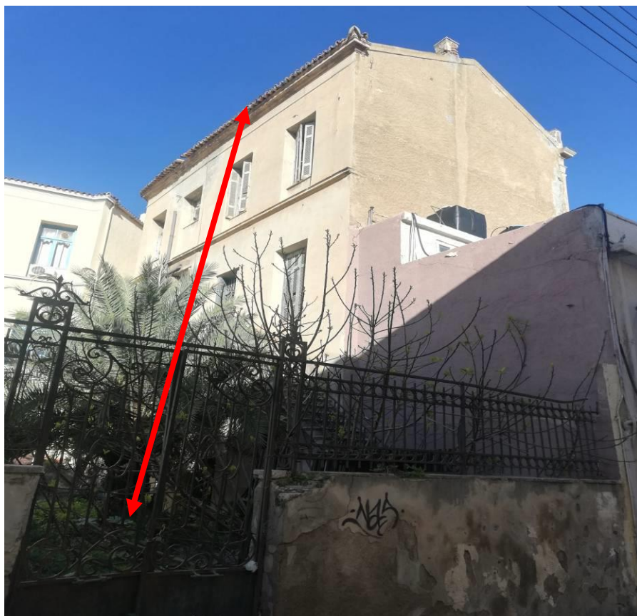
(Σημείο απομάκρυνσης προϊόντων καθαιρέσεων)