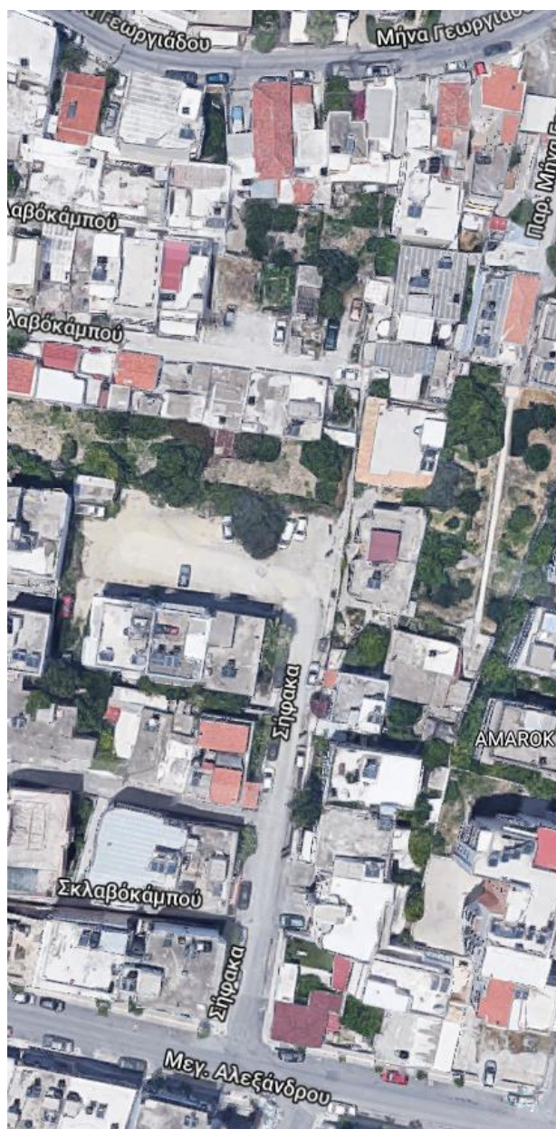
α. Τμήμα της οδού Σήφακα

Οι υπό μελέτη περιοχές του Δήμου Ηρακλείου, όπως αναφέρονται στο άρθρο 1 του παρόντος, απεικονίζονται ενδεικτικά στα παρακάτω αποσπάσματα από τους χάρτες Google.