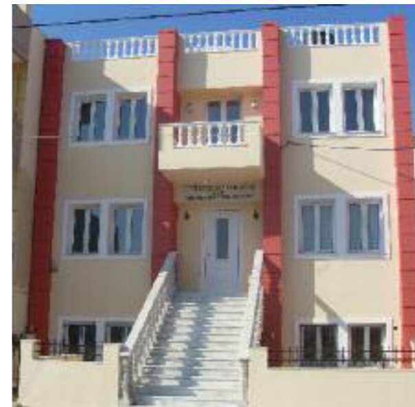
ΚΕΝΤΡΟ ΔΗΜΙΟΥΡΓΙΚΗΣ ΑΠΑΣΧΟΛΗΣΗΣ ΚΑΙ ΕΚΦΡΑΣΗΣ ΠΟΛΙΤΙΣΤΙΚΟΥ ΣΥΛΛΟΓΟΥ ΑΓΙΑΣ ΑΙΚΑΤΕΡΙΝΗΣ (ΝΕΟ ΙΔΙΟΚΤΗΤΟ ΚΤΙΡΙΟ)

Η ΕΙΣΟΔΟΣ ΕΙΝΑΙ ΕΛΕΥΘΕΡΗ ΣΕ ΟΛΕΣ ΤΙΣ ΕΚΔΗΛΩΣΕΙΣ ΚΑΙ ΘΑ ΠΡΑΓΜΑΤΟΠΟΙΟΥΝΤΑΙ ΣΤΟ ΠΑΡΚΟ ΤΗΣ ΕΚΚΛΗΣΙΑΣ ΤΗΣ ΑΓΙΑΣ ΑΙΚΑΤΕΡΙΝΗΣ Έναρξη Εκδηλώσεων: Καθημερινά 9 το βράδυ