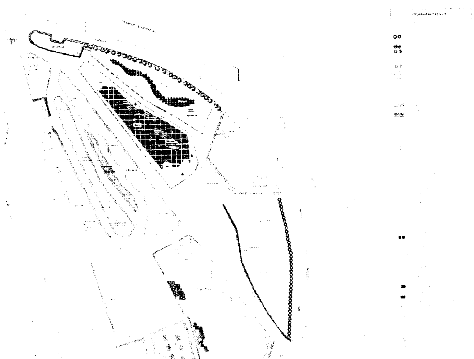
Σχ. 2_ Ενδεικτική παρέμβαση ενοποίησης πεζοδρομίων.