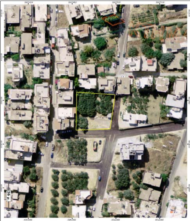
ΑΠΟΣΠΑΣΜΑ ΟΡΘΟΦΩΤΟΓΡΑΦΙΩΝ ΚΤΗΜΑΤΟΛΟΓΙΟΥ Κ.: 1/2000