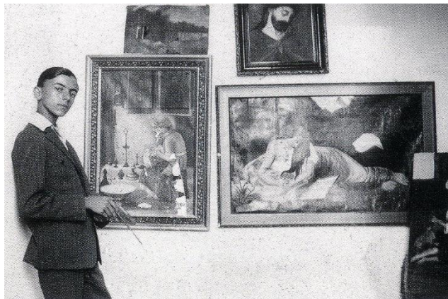
Νεανική φωτογραφία του ζωγράφου γύρω στο 1928.