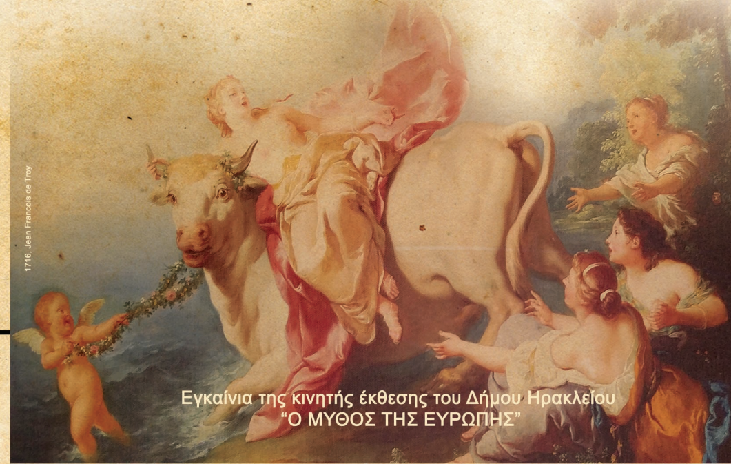
1716, Jean-François de Troy

«ΔΥΝΑΤΟΤΗΤΕΣ, ΕΥΡΩΠΑΙΚΗ ΕΝΩΣΗ, ΔΙΚΤΥΩΣΗ ΚΑΙ ΕΝΕΡΓΟΙ ΕΥΡΩΠΑΙΟΙ ΠΟΛΙΤΕΣ»