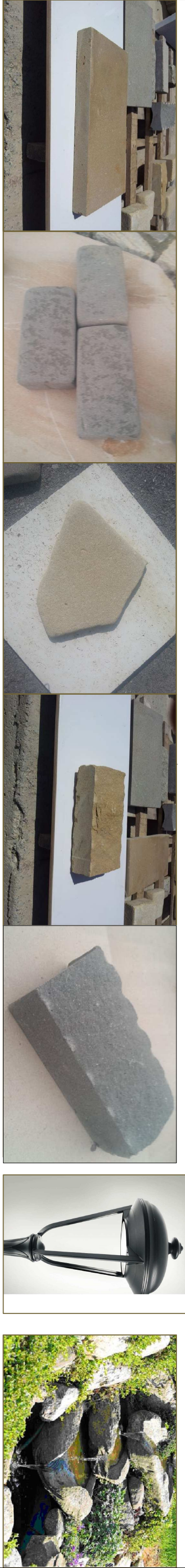
ΠΡΟΤΕΙΝΟΜΕΝΑ ΥΛΙΚΑ ΚΑΤΑΣΚΕΥΗΣ