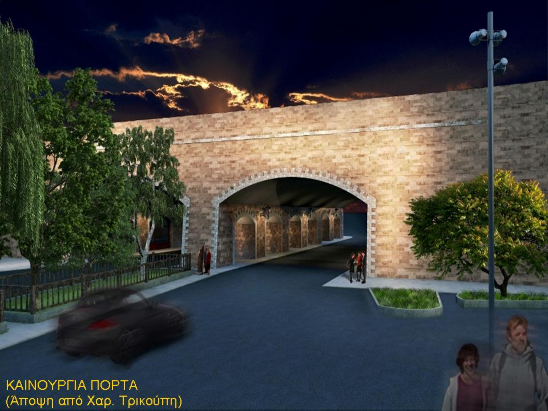
ΚΑΙΝΟΥΡΓΙΑ ΠΟΡΤΑ (Άποψη από Χαρ. Τρικούπη)