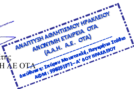
Γιάννης Δροσίτης Πρόεδρος ΑΑΗ ΑΕ ΟΤΑ

Πληροφορίες Παγκρήτιο Στάδιο: Δημήτριος Κ. Τσιράκος, 2810 264 568